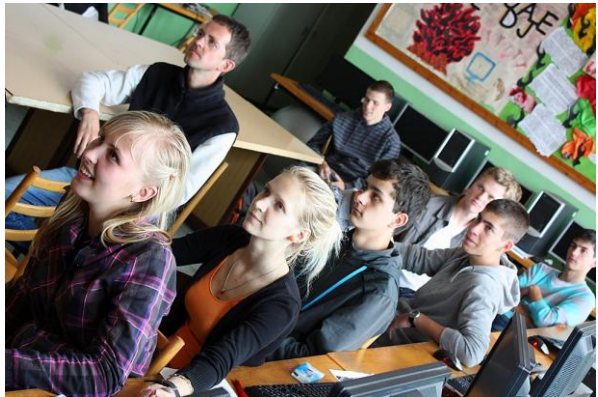
Projektarbeit und -präsentation