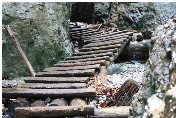
Erkundungen in den Nationalparks der Karpatenregion