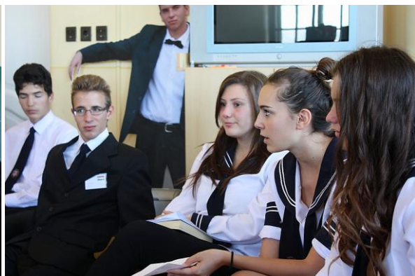
Aufnahmen von der Schulrunde / Képek az iskolai döntőről